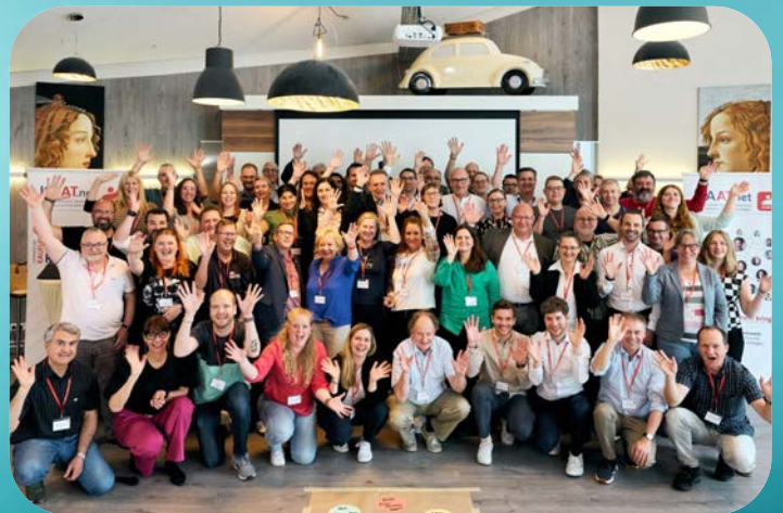
Teilnehmende des 4. KAAT-Dialogs 2024

Der KAAT-Dialog ist unsere jährliche Tagung für KAAT-Mitglieder, ihre Betriebsräte und Vertrauensleute. Dieses Jahr laden wir nach Hannover ein: Am 4. und 5. Juli gibt es Input zu vielen Themen, Diskussionen sowie Zeit für einen intensiven Austausch – und natürlich wollen wir das „kleine“ Jubiläum mit dir feiern. Für IGBCE-Mitglieder sind Teilnahme, Hotelzimmer und Verpflegung kostenlos!